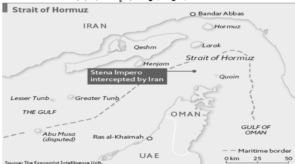
شكل (2): يوضح الموقع الجغرافي لمضيق هرمز