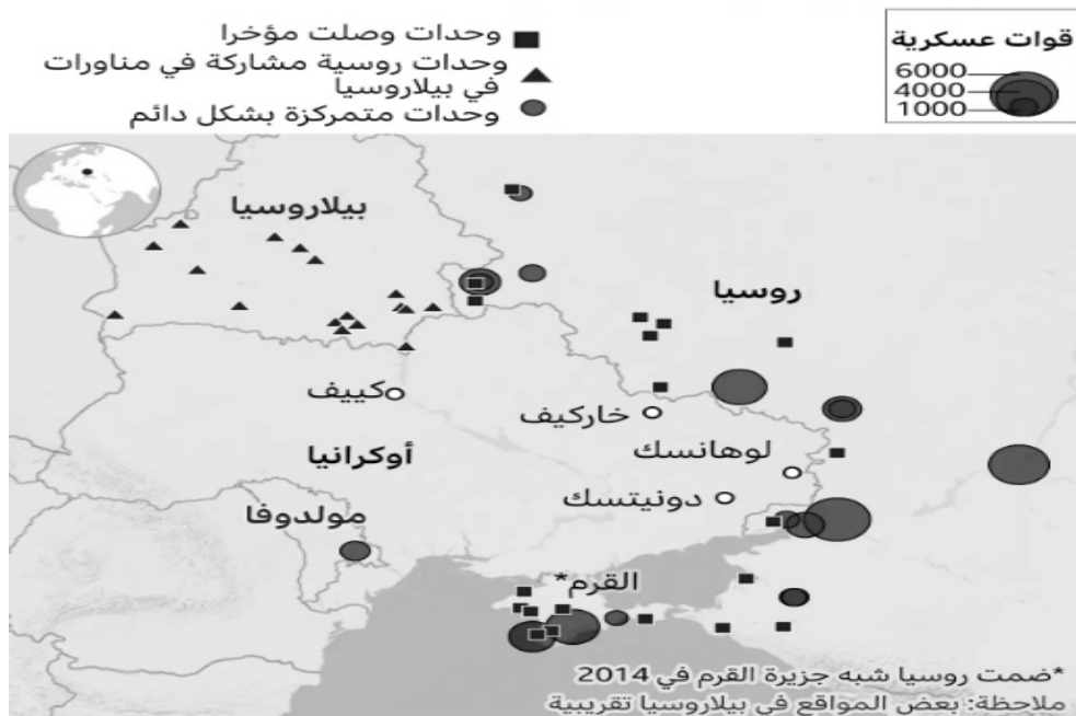
شكل (1) أماكن تمركز القوات الروسية

بداية الأزمة الحالية تعود إلى نوفمبر 2022 عندما بدأت روسيا في نقل أعداد هائلة من قوات جيشها إلى المناطق القريبة من الحدود الأوكرانية (شكل 1) لكن في 15 فبراير، وبعد أن وصل عدد تلك القوات إلى 100 ألف، قال الرئيس بوتين إنه سيكون هناك انسحاب جزئي للقوات الروسية